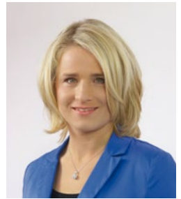
Verena Bentele Beauftragte der Bundesregierung für die Belange behinderter Menschen

»Seit 45 Jahren ist die Deutsche Rheuma-Liga als Interessenvertretung für Menschen mit rheumatischen Erkrankungen aktiv. Dieses Engagement tut not, denn gerade an Rheuma erkrankte Kinder und Jugendliche erfahren immer noch zu oft Ausgrenzungen statt Verständnis und Unterstützung. Deswegen freue ich mich auch besonders über das große Engagement junger Menschen in der Selbsthilfe.«